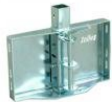
Stift Ø16 mm für Haken