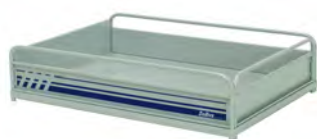
PIANALE 885X1250XH230 MM