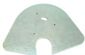
ZAVORRA 8 KG