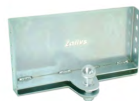
GANCIO CON ATTACCO A SFERA