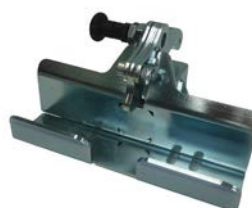
GANCIO PER ROLL BOX