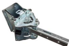
SUPPORTO PER GANCI