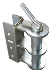
GANCIO SPINA Ø40 MM