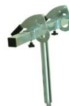
GANCIO BIDONI SPAZZATURA