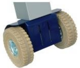
Differenza prezzo per cambio ruote da standard a superelastiche antitraccia (2 ruote)