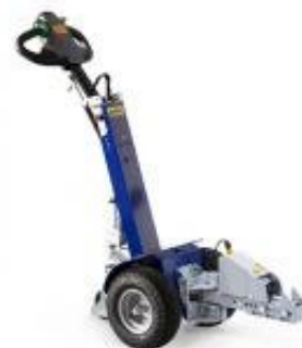
Gancio pinza elettrica