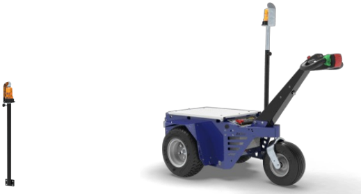
Teleskopstange mit LED Rundumleuchte