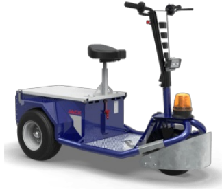
Kit paraurti anteriore