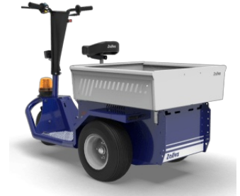
Cesto 730x730xh220 mm