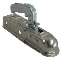
Giunto sfera per rimorchi