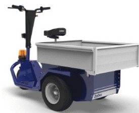
Cesto 780 x 850 x h220 mm