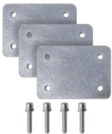
Kit spessori per fissaggio supporto girofaro