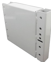
Prolunga per ganci con tubo