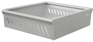
Cesto 730x730xh160 mm