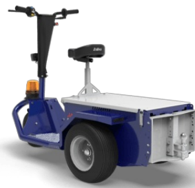
Gancio con sfera-perno Ø20-25