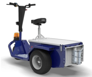
Gancio con spina Ø35 mm