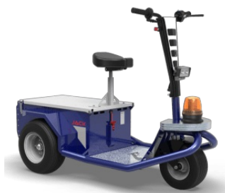
MAX 3 pz. - Zavorra 8 kg