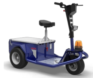
Porta oggetti per manubri