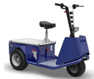
Carter frontale di protezione