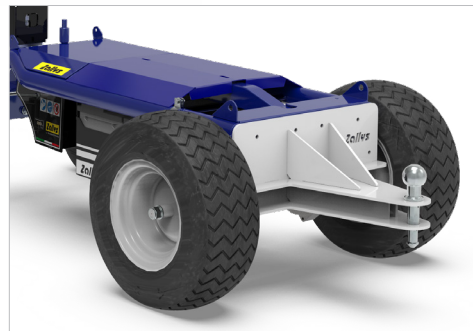
GANCIO CON SFERA-PERNO Ø20-25